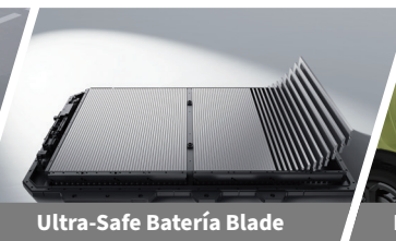
Ultra-Safe Batería Blade