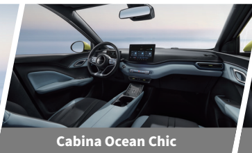
Cabina Ocean Chic