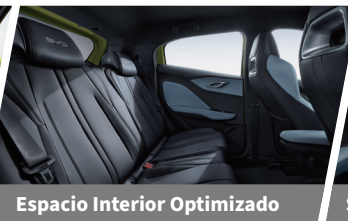
Espacio Interior Optimizado