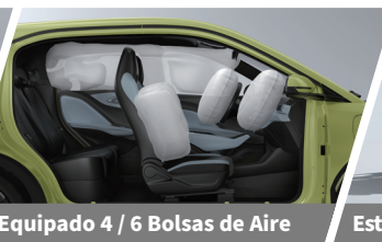
Equipado 4 / 6 Bolsas de Aire