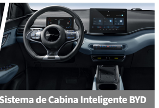
Sistema de Cabina Inteligente BYD