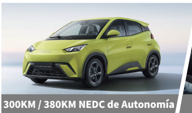
300KM / 380KM NEDC de Autonomía