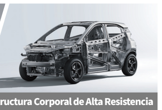
Estructura Corporal de Alta Resistencia

La autonomía (total de kilómetros que puede recorrer un vehículo eléctrico sin hacer paradas para recargar) descrita en la ficha técnica, depende de diferentes factores, incluyendo de manera enunciativa y no limitativa de la capacidad de su batería, el uso que se haga del motor, las características del vehículo, el estilo de conducción, condiciones de manejo, los hábitos de manejo del usuario, las condiciones del camino, así como el peso y tamaño del vehículo, su potencia, el tipo de carretera, el clima, la velocidad, del propio conductor, entre otros.